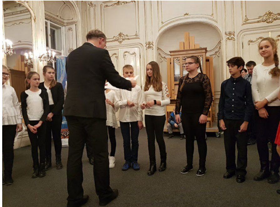
Diplomy a ocenění úspěšných žáků naší ZUŠky. Děkujeme za reprezentaci školy i naší obce.