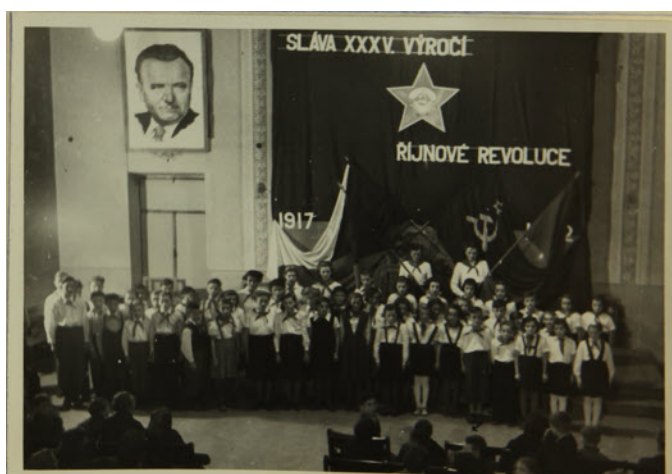
foto: Pionýrský slib

V pátek 10.11. 2017 se od 19:00 hod koná v hasičárně valná hromada SDH Benešov nad Černou. S sebou 100,- Kč (příspěvek)